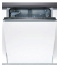
BOSCH Lavavajillas integrable