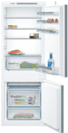
BOSCH Frigorífico integrable