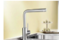
BLANCO MILA Grifería