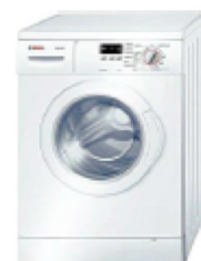
BOSCH Lavadora libre instalación