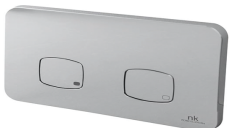
Pulsador doble smart Line Concept y BTW Lounge N Rimless Porcelanosa

Interior water supply, using cross-linked polyethylene pipes. In bathrooms, the glazed porcelain bathroom fittings will be by Porcelanosa except for the bathtubs and shower trays that will be acrylic. In bathtubs and showers, there will be taps by Porcelanosa. All other bathrooms fittings will have mixer taps. Taps and bathrooms fittings will use a water use reductions system. Continuous washbasins.