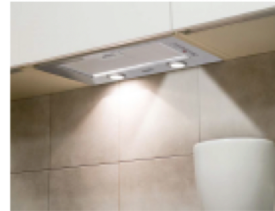
PANDO Grupo filtrante