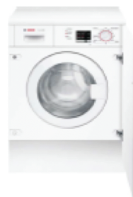
BOSCH Lavadora integrable