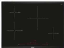
BOSCH Placa inducción 80 (viv. tipo 4)

Kitchen by Porcelanosa. Colours can be personalized.