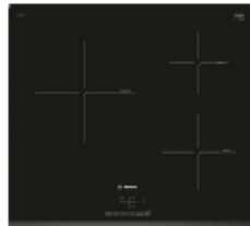
BOSCH Placa inducción 60